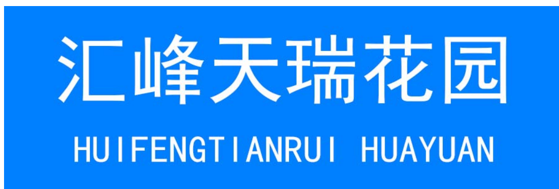
图 1 住宅小区地名标识标志设置样式(参考)