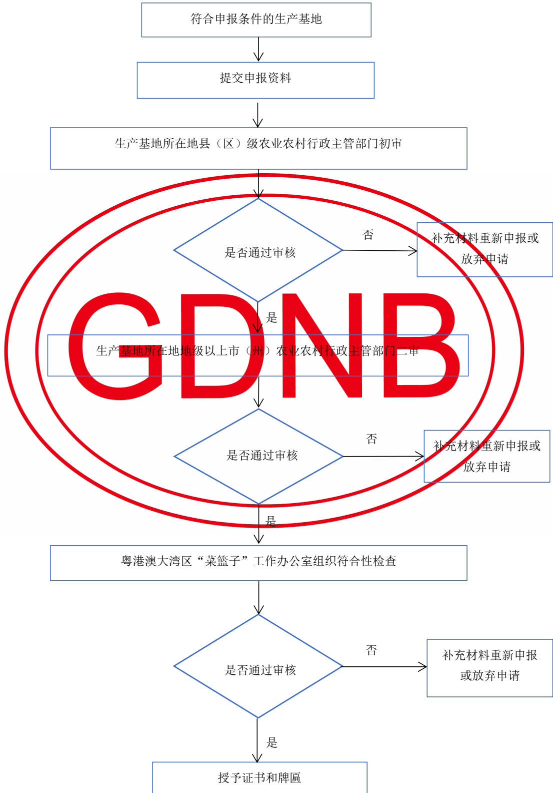
图 B.1 粤港澳大湾区“菜篮子”生产基地申报流程图